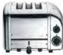
3 slot toaster