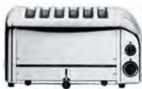
6 slot toaster