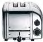
2 slot toaster