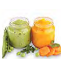
Nutrienti pappe per bimbi