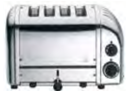
4 slot toaster